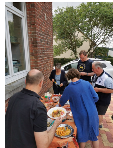
F'estivales à Condette et Rencontre d'équipe CMR à Brillion