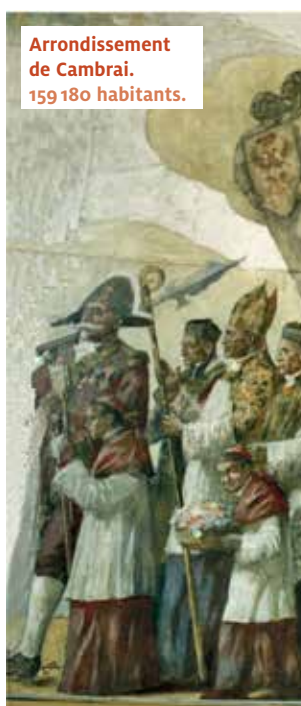
Arrondissement de Cambrai. 159 180 habitants.