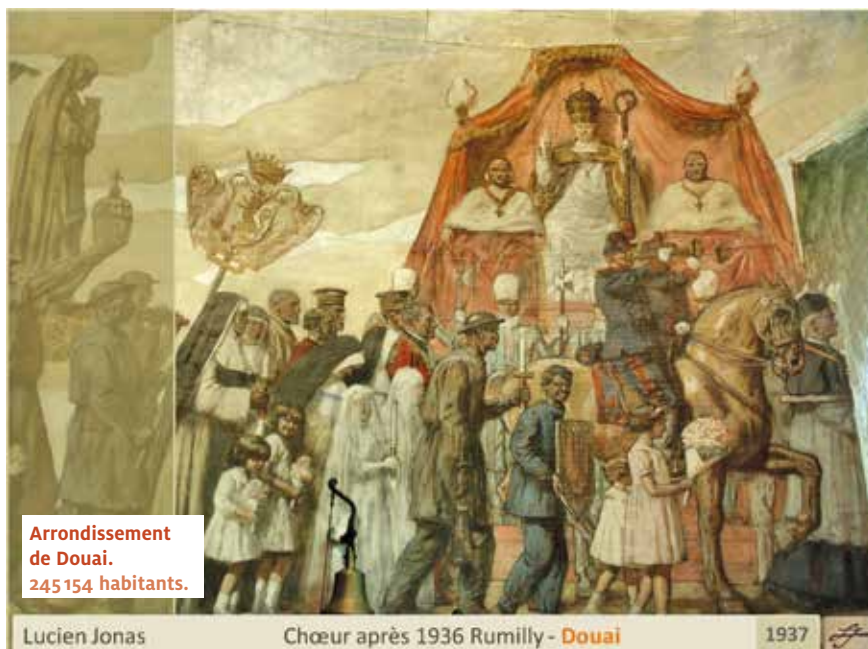
Marcher ensemble, avec Marie, vers son Fils.

Arrondissement de Douai. 245 154 habitants.