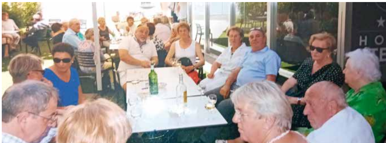
À Lourdes, on ne boit pas que de l'eau de Lourdes : un petit jurançon entre amis, c'est sympa aussi !