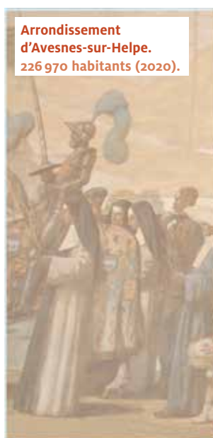
Arrondissement d'Avesnes-sur-Helpe. 226 970 habitants (2020).

Il y a sur les murs de l'église un peuple en marche. Et il nous invite à le rejoindre, à nous faire, nous aussi, pèlerins, peuple en marche sur les chemins de l'Évangile et du monde. Quittons nos