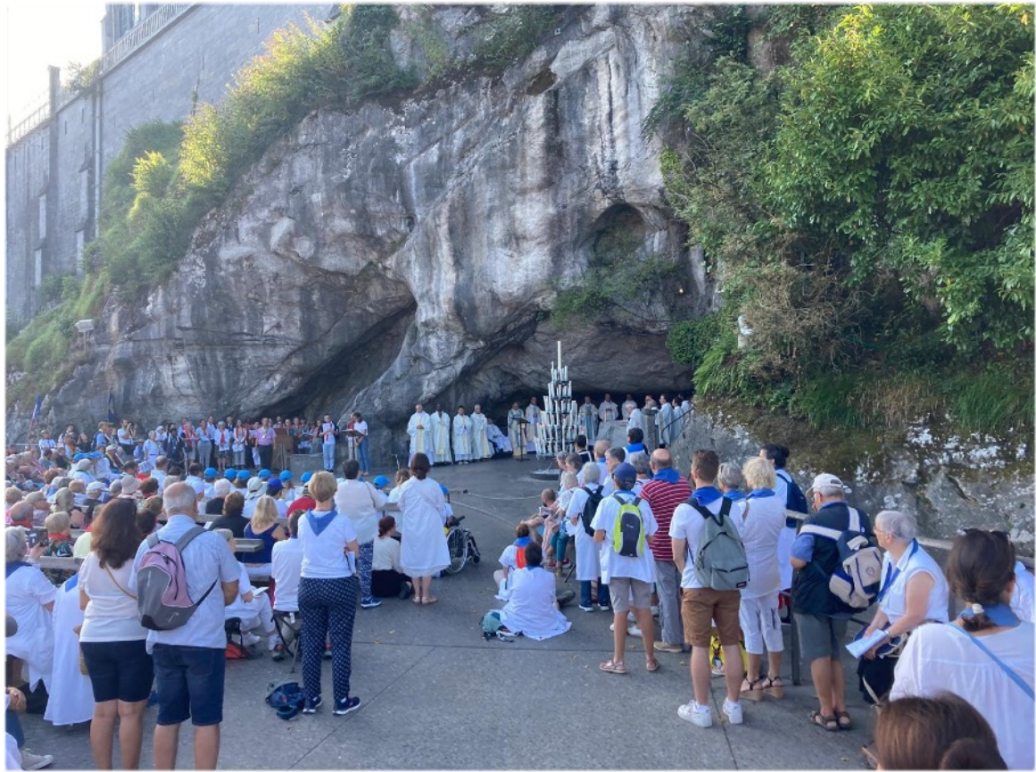
Toutes les photos et tous les textes sur le pèlerinage de Lourdes