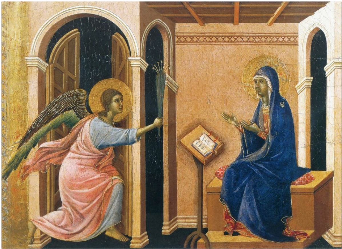
Duccio, Annonciation de la mort de la Vierge Italie, 1308-1311 Sienne, Museo de la Cathédrale

« Mon âme exalte le Seigneur, exulte mon esprit en Dieu, mon Sauveur ! Il s'est penché sur son humble servante ; désormais, tous les âges me diront bienheureuse. Le Puissant fit pour moi des merveilles ; Saint est son nom ! Son amour s'étend d'âge en âge sur ceux qui le craignent. Déployant la force de son bras, il disperse les superbes. Il renverse les puissants de leurs trônes, il élève les humbles. Il comble de biens les affamés, renvoie les riches les mains vides. Il relève Israël son serviteur, il se souvient de son amour, de la promesse faite à nos pères, en faveur d'Abraham et de sa race, à jamais. Gloire au Père, et au Fils, et au Saint-Esprit, pour les siècles des siècles. Amen.»