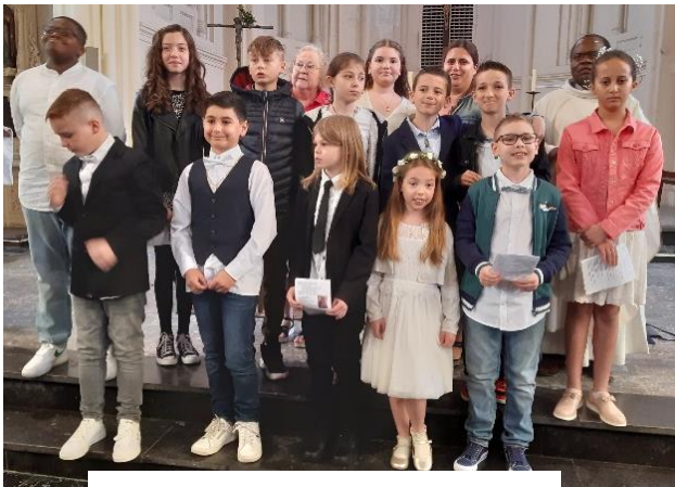
Première communion 14 mai à Neuville