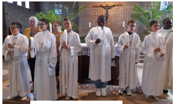
Profession de Foi 27 mai à Roelux