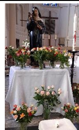
Sainte Rita 20 mai

Mardi 6 et 27 juin de 17h30 à 19h30 rencontre des enfants-parents de 1 ère année de Caté