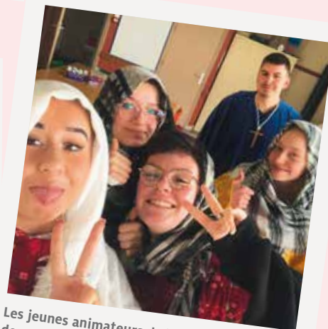
Les jeunes animateurs de la retraite de profession de foi à Somain.