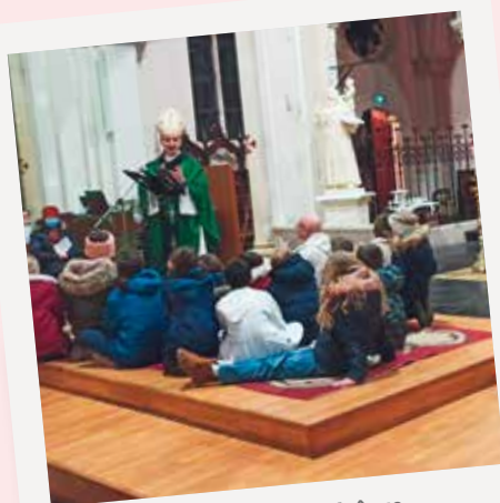
Célébration autour de notre évêque en l'église d'Auberchicourt.