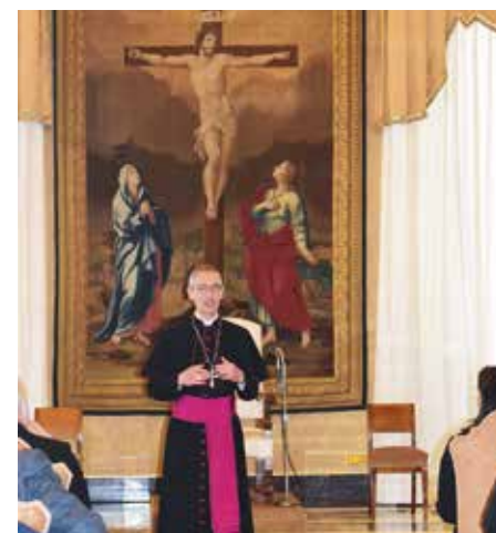
Lors d'une visite à Rome, en 2022.

En Jésus mort et ressuscité, Dieu a manifesté à l'humanité son désir de lui donner concrètement et réellement part à sa vie. En effet, si Jésus est entré corps et âme dans la vie de Dieu, une part de nous-même est déjà en Dieu, déjà ressuscitée. « Vous êtes ressuscités avec le Christ. Recherchez donc les réalités d'en haut », ose affirmer saint Paul en s'adressant aux baptisés (Col 3,1). Par le baptême, notre existence est définitivement orientée vers le Ciel.