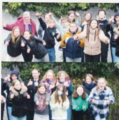
Retraite de profession de foi à Somain.