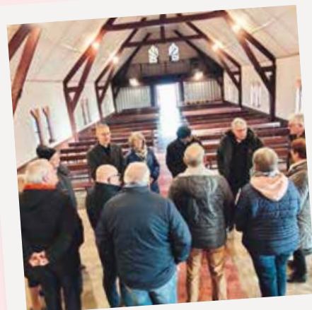
Rencontre entre autorités civiles et religieuses, à la chapelle de Masny.