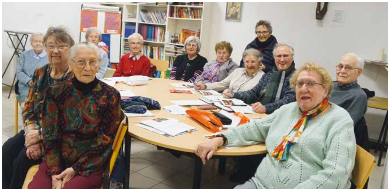
Une réunion du groupe MCR de Somain.