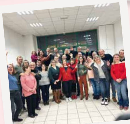
Retrouvailles des couples mariés en 2022 dans la paroisse Saint-Jean-Bosco.