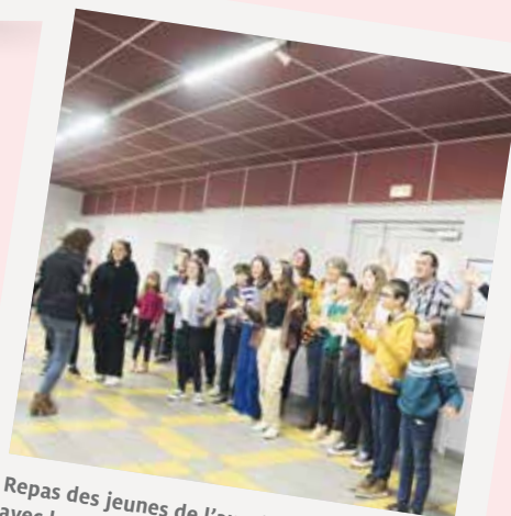
Repas des jeunes de l'aumônerie avec leur famille.