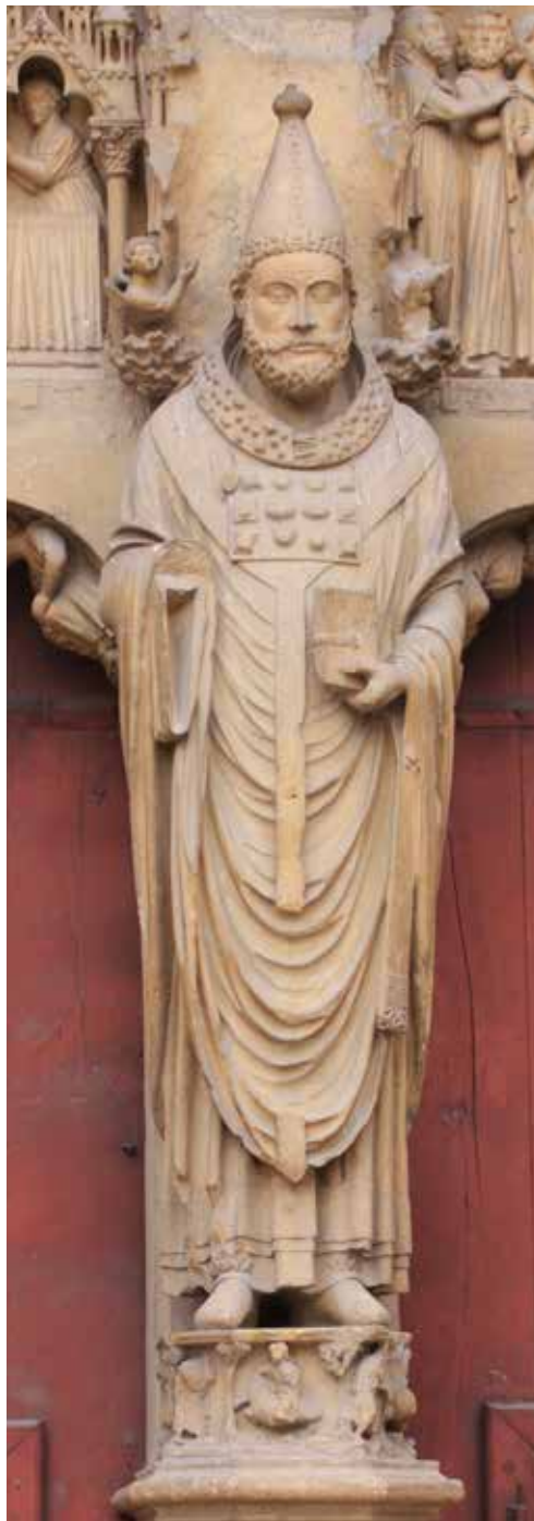
Calixte, du grec Kallistos, signifie « le plus beau ».

Les persécutions ayant repris, le pape Calixte et dix prêtres se réfugient dans la maison de Pontien. La maison est entourée de soldats et, pendant quatre jours, le pape et les prêtres sont privés de nourriture. Un soldat souffrant d'un ulcère demande sa guérison à Calixte. Il lui dit : « Si vous croyez de tout