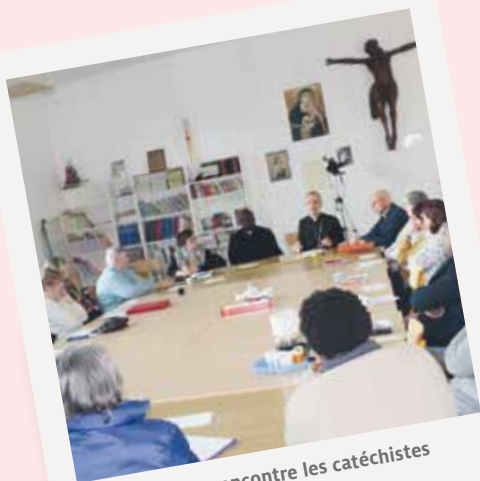
Notre évêque rencontre les catéchistes et les prêtres du doyenné.