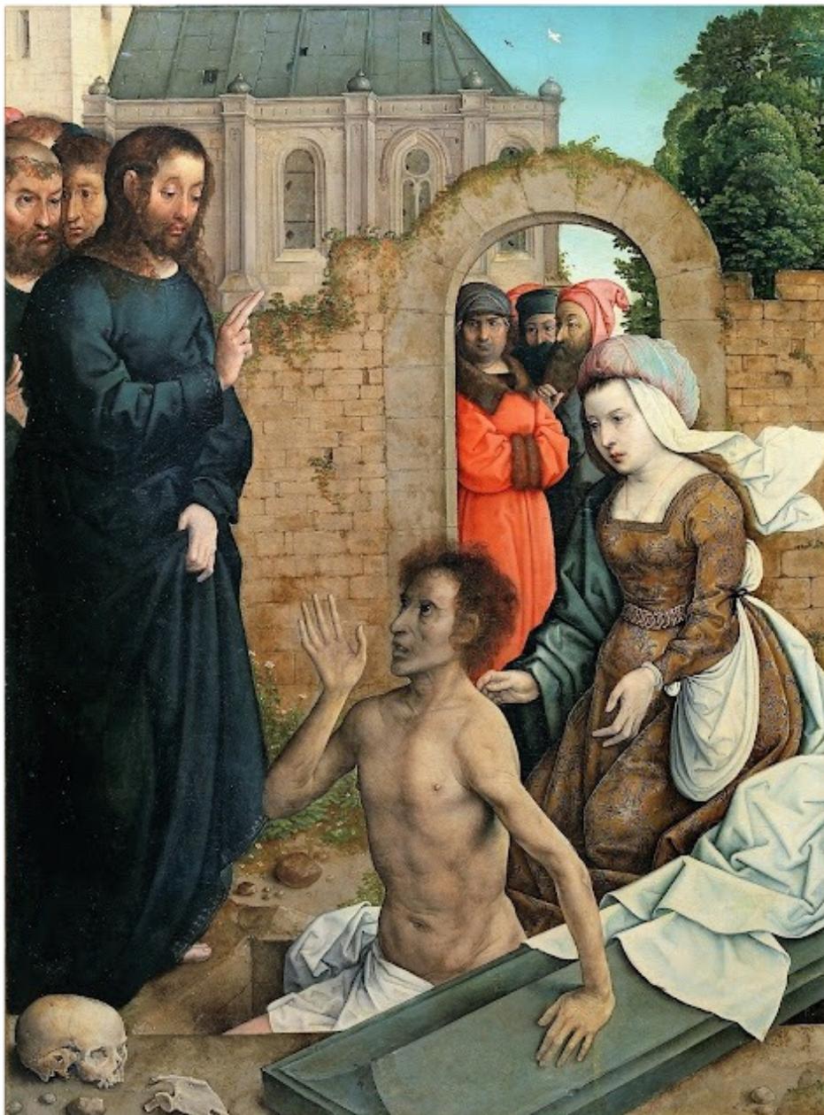
Jean de Flandres, Résurrection de Lazare Flandres, 1514-1519 Madrid, Musée national du Prado