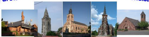
Abscon Escaudain Lourches Neuville Roelux