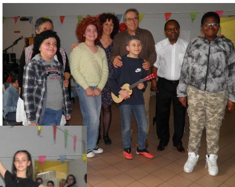
Animations au cours du repas