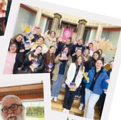
À Maubeuge, les grands jeunes.