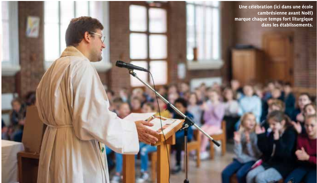
Une célébration (ici dans une école cambrésienne avant Noël) marque chaque temps fort liturgique dans les établissements.