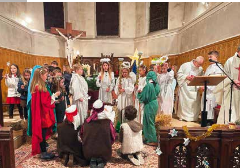
Crèche vivante en l'église de Féchain.