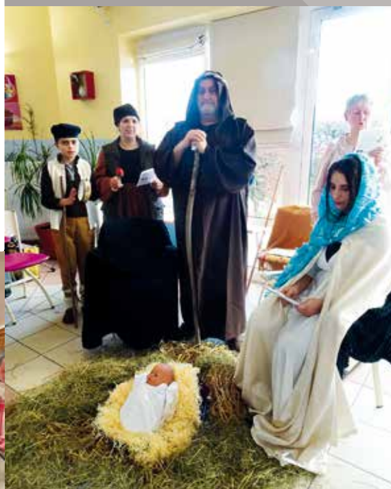
Crèche vivante à l'hôpital d'Hautmont.