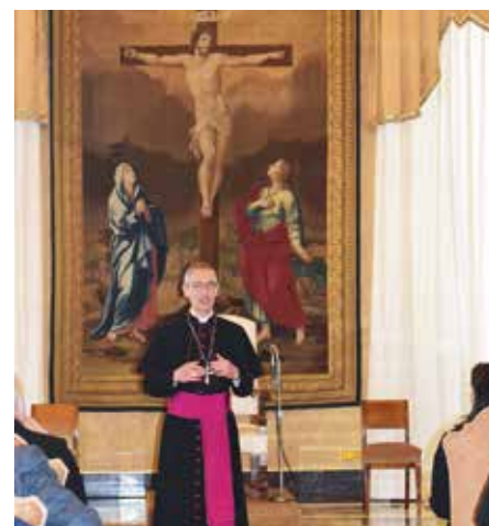
Lors d'une visite à Rome, en 2022.

En Jésus mort et ressuscité, Dieu a manifesté à l'humanité son désir de lui donner concrètement et réellement part à sa vie. En effet, si Jésus est entré corps et âme dans la vie de Dieu, une part de nous-même est déjà en Dieu, déjà ressuscitée. « Vous êtes ressuscités avec le Christ. Recherchez donc les réalités d'en haut », ose affirmer saint Paul en s'adressant aux baptisés (Col 3,1). Par le baptême, notre existence est définitivement orientée vers le Ciel.