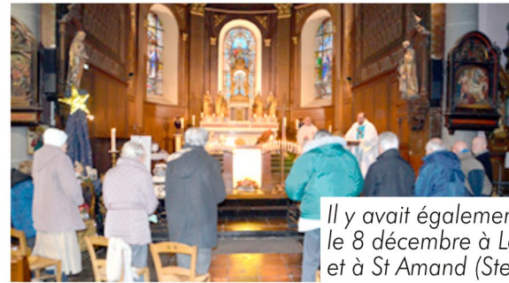
Il y avait également le chapelet le 8 décembre à Lecelles et à St Amand (Ste Thérèse).