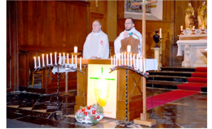
Messe à la bougie, église de Hasnon

Quel plaisir ensuite de nous rendre à pied à St Martin, bravant le froid par une marche rapide et passant tout à côté du marché de Noël... nous rappelant que la grande fête approche !