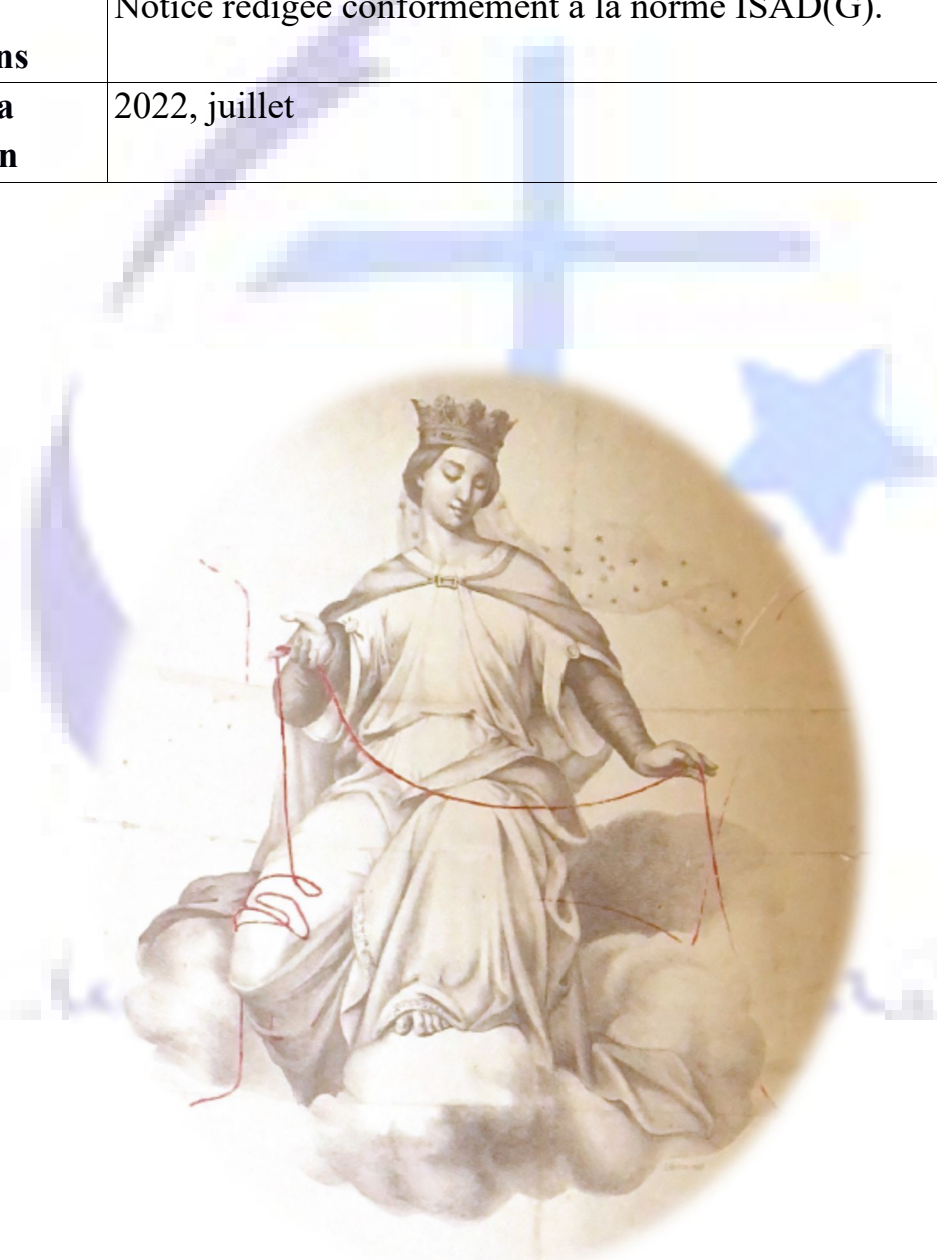
Figure 2: Lithographie représentant la Vierge de Notre-Dame du Saint-Cordon dont le cordon est coloré en rouge réalisée d'après la lithographie de Charles CRAUK, 1852 (Arch. Dioc 446 AP.229)