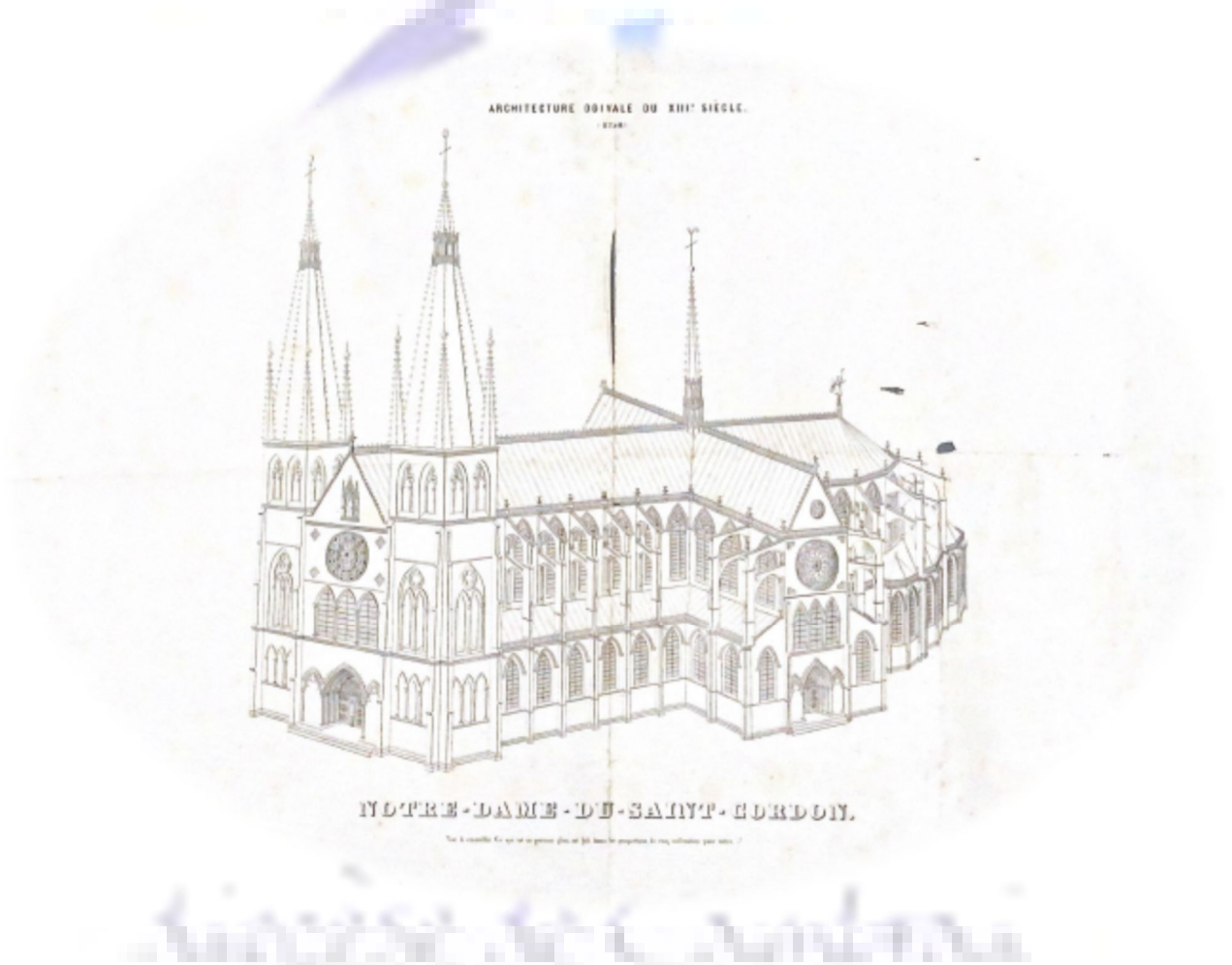
Figure 1: Vue d'ensemble de la basilique Notre-Dame du Saint-Cordon, dessin à partir d'une gravure, XIII ème siècle (Arch. Dioc. 446 AP. 120)