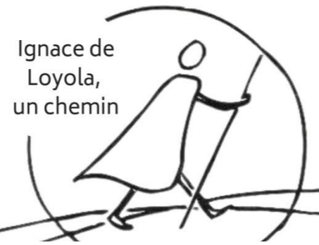
Ignace de Loyola, un chemin

Tous les jeudis du 21 juillet au 1 sept 2022 de 17h00 à 18h30, adoration, chapelet, messe à Wavrechain sous Denain