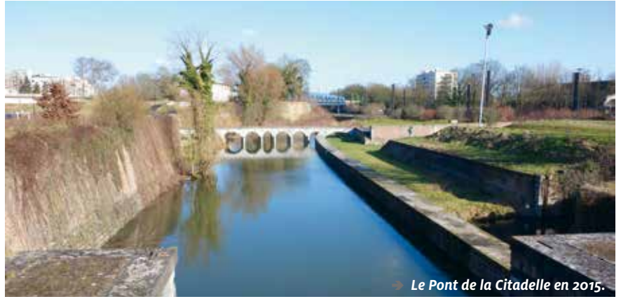
→ Le Pont de la Citadelle en 2015.

Il n'y a pas si longtemps, l'Escaut traversait entièrement Valenciennes ! Après avoir franchi l'écluse des Repenties et le pont de la citadelle, il entrait en ville en longeant la résidence des Charriers, passait derrière les Académies, la bibliothèque, l'église Saint-Nicolas, traversait la rue Émile-Durieux en passant sous le pont Sainte-Croix que l'on peut encore deviner, longeait toute une série de maisons et de commerces de la rue de Paris (dont certains ont encore un quai sur l'arrière qui permettait de charger ou décharger des marchandises), traversait la rue Saint-Jacques sous le pont éponyme, puis arrivait au port de Valenciennes au niveau du pont Néron sur lequel se trouvait le «Grand Christ» de Jacques Perdrix que l'on peut voir actuellement dans l'église Saint-Géry. Le pont Néron se trouvait à l'emplacement de l'actuelle rue de la Poste ; à cet endroit, l'Escaut faisait trente mètres de large. Le fleuve continuait ensuite son chemin entre la rue Saint-Géry et la rue de l'Intendance, les courbes de cette dernière suivaient parfaitement le cours de l'eau, et après être passé sous le pont Neuf et avoir longé l'Hôpital Général, il finissait par sortir de la ville par la «porte d'eau».