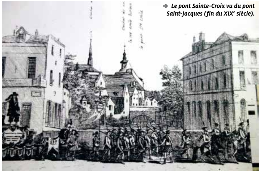
→ Le pont Sainte-Croix vu du pont Saint-Jacques (fin du XIX e siècle).