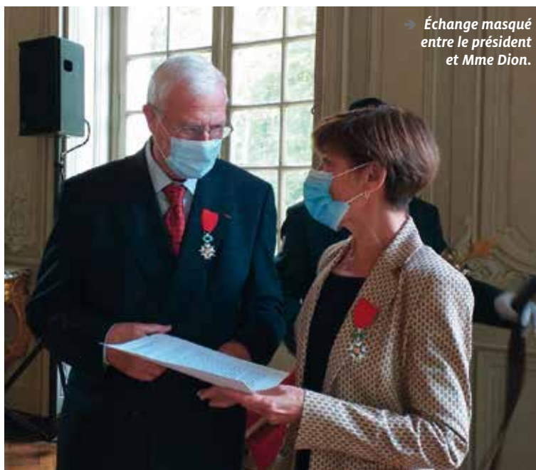
→ Échange masqué entre le président et Mme Dion.