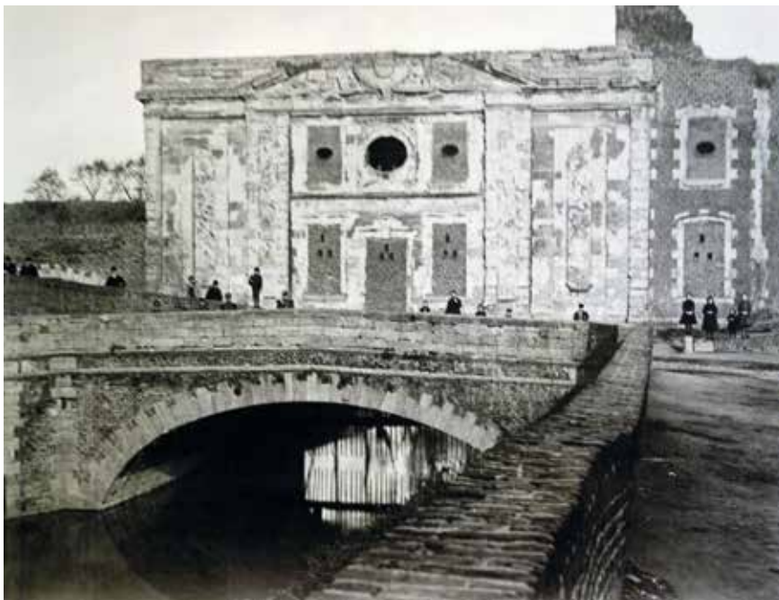
→ La porte d'eau à la fin du XIX e siècle.