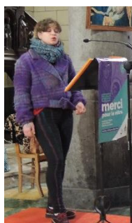
Messe des familles avec la chorale des jeunes