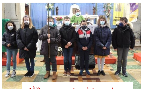
1 ère communion à Lourches

Pour qu'il y ait toujours une présence à l'église devant le Saint Sacrement vous pourrez vous inscrire sur le planning (aux différentes messes)