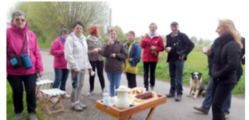
Marche du lundi de Pâques