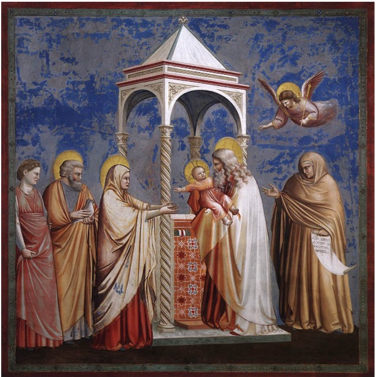
Giotto, Presentation Italie, 1304-1306 Padoue, Chapelle Scrovegni/Arena