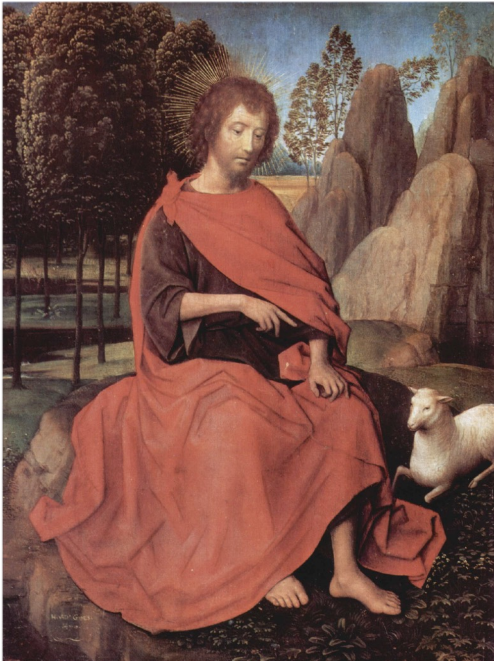
Saint Jean Baptiste, par Hans Memling (1470)