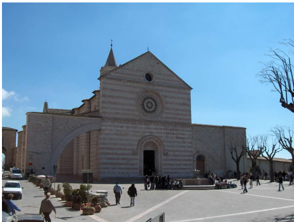
Basilique Sainte Claire