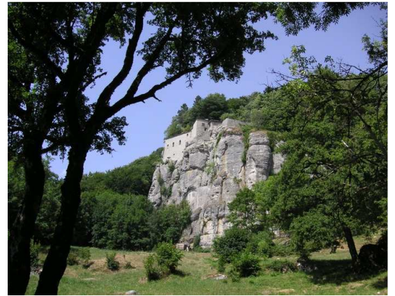
Rocher La Verna

11h00: Visite du sanctuaire et célébration de la messe 13h00: Déjeuner des pèlerins à l'hôtellerie du couvent 15h00: Procession des frères Franciscains 15h30: Retour vers Assise 17h30 Arrêt à Rivortorto où se trouve la première cabane qui a abrité St François 19h00 Dîner à l'hôtel Minerva