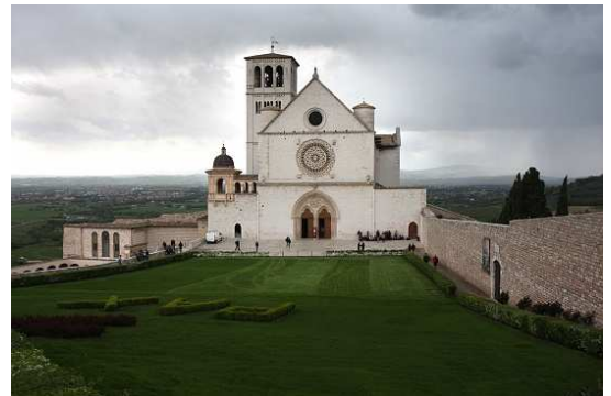
Basilique St François

8h00 Départ vers la Basilique Saint François Célébration de la messe et visite des 2 basilique: 12h30 Déjeuner à l'hôtel Minerva 15h00 Départ vers Sainte-Marie majeure où repose le jeune Carlo Acutis béatifié en 2020 Après-midi libre 19h00 Dîner à l'hôtel Minerva et soirée partage