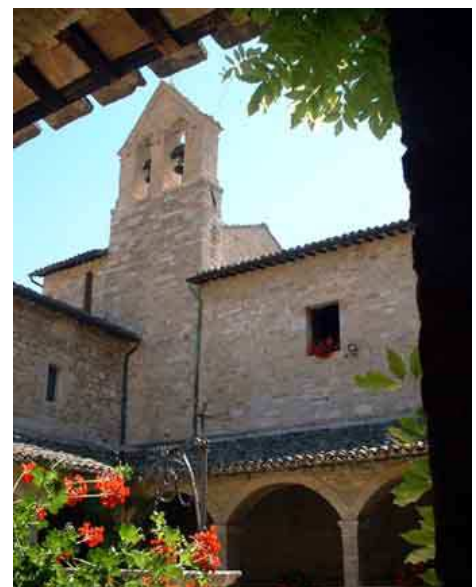
Chapelle Saint Damien