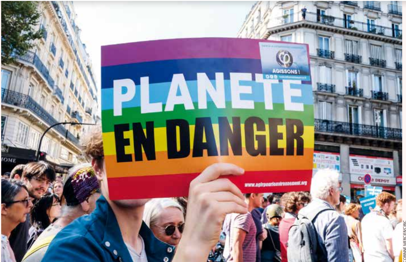
→ Marche pour le climat dans les rues de Paris (septembre 2018).

Il est grand temps de sauver notre « maison commune », et chacun de nous est concerné ! En 2015, le pape François a lancé un cri d'alarme en faveur de notre Terre, à destination de tous et en particulier des croyants : l'encyclique « Laudato si' », pour une écologie globale.