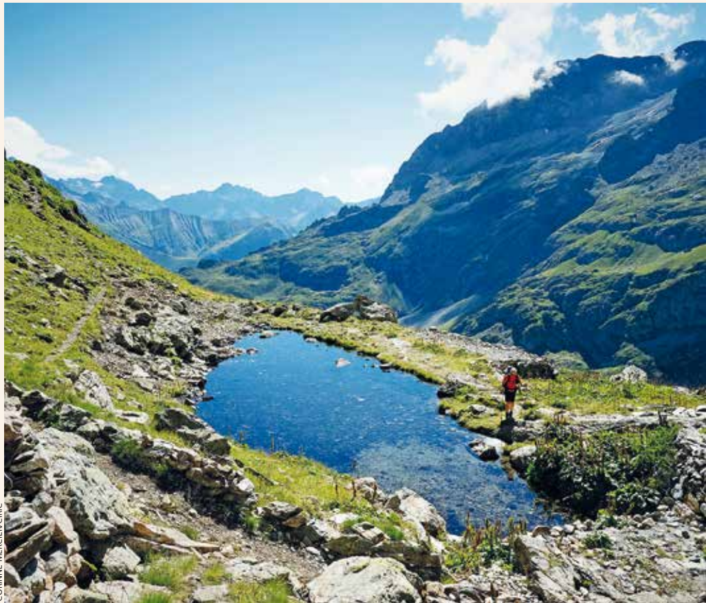
→ Près du refuge du Pigeonnier, dans le Parc des Écrins (La Chapelle-en-Valgaudémar, Hautes-Alpes).

En effet, j'ai traversé des territoires ravagés par la désindustrialisation, des friches, des ruines ; j'ai rencontré des gens désespérés. Au point que j'avais alors alerté le président Hollande. C'est dire si le mouvement des gilets jaunes ne m'a pas surpris. Des pans entiers de notre territoire ne voient plus où est leur avenir. Et le contraste