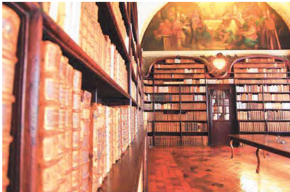
La bibliothèque peinte de Valenciennes, aux tons chaleureux, recèle plus de quarante mille ouvrages.

Épargnée par la Révolution, la bibliothèque des jésuites est l'un des rares exemples français de bibliothèque peinte de l'Ancien Régime.