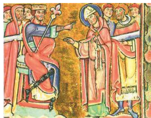
Saint Amand à la cour de Dagobert (enluminures sur parchemin réalisées par le scriptorium de l'abbaye de Saint-Amand).