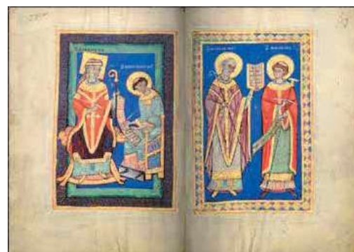
Scène de la vie de saint Amand : le saint dicte son testament à Baudémont en présence des saints Mummolet et Réole (enluminures sur parchemin réalisées par le scriptorium de l'abbaye de Saint-Amand).