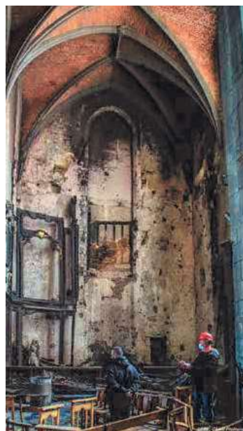
Autel Saint-Nicolas en mai 2021.

Un prochain article évoquera les étangs des Moines aux XIX e et XX e siècles.