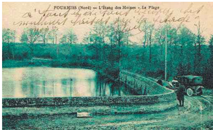
L'étang des Moines au début du XX e siècle.

Les villageois de Fourmies réclament au propriétaire du moulin seigneurial, l'abbaye de Liessies, la création de petits étangs pour servir de réservoirs. En cas de pénurie, il serait alors possible de relâcher de l'eau afin de faire tourner la roue du moulin à farine. Pour cela, les Fourmisiens vendent aux moines une partie de leurs « aisemens », des biens communaux situés à plusieurs kilomètres du moulin (situé face à l'Écomusée d'aujourd'hui). En amont du moulin, pour compenser les pertes et le faible débit occasionnés par la distance, un bassin recueillait et stockait les eaux avant de les déverser sur les roues. Les biens communaux achetés, l'abbaye Saint-Lambert fait ériger trois digues par les entrepreneurs Toussaint Maronel et Arnould Chabeau qui construisent un vannage complexe pour contrôler l'eau. Ces chaussées barrent la vallée créée par le ruisseau pour faire monter l'eau, rendant inutile tout creusement. Les travaux coûtent plus de trente-cinq mille livres. Naissent alors les étangs des Moines, en 1696. En 1754, l'abbaye précise qu'elle fera « le plutôt possible des reversoirs aux deux étangs du haut selon le modèle de celui du bas ». Elle fait