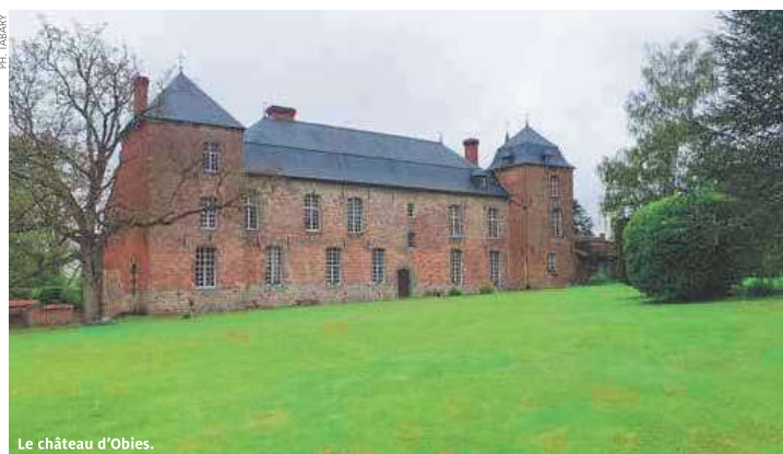
Le château d'Obies.

Plus de renseignements : pe.tabary@orange.fr