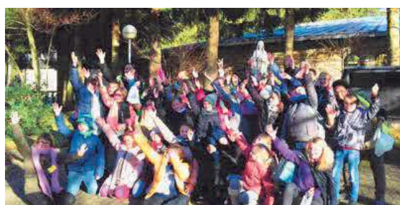
Pèlerinage à Bayeux en 2019.