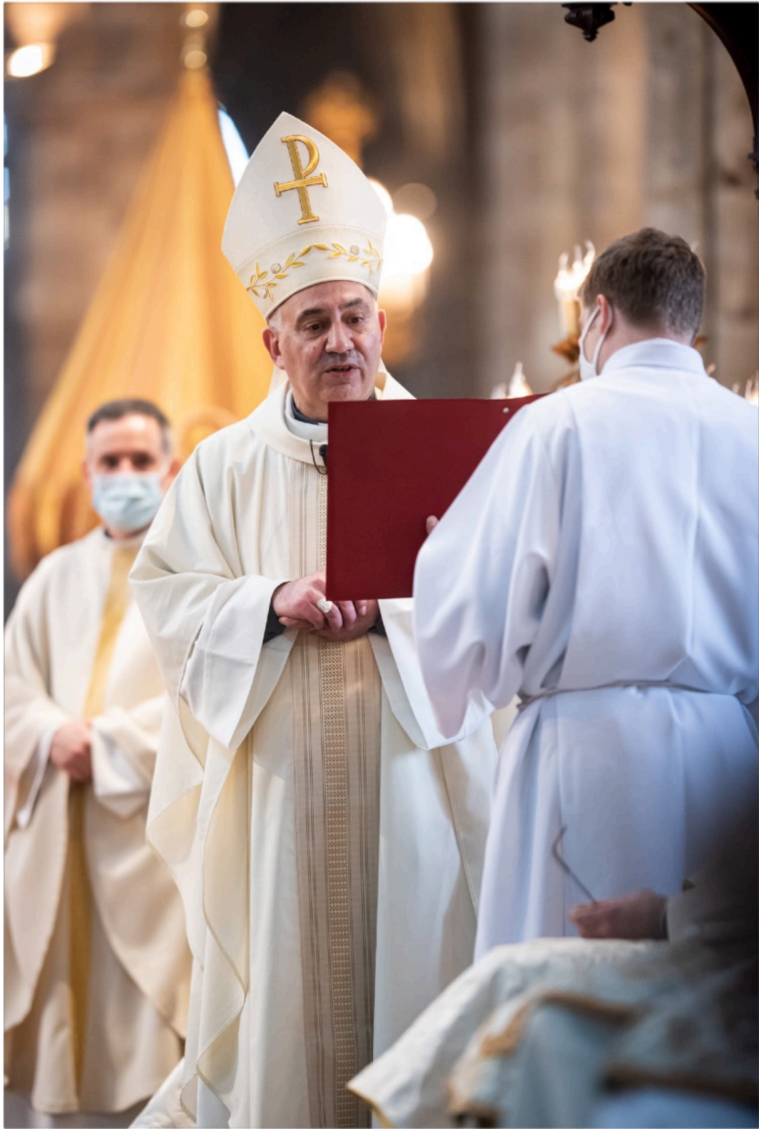
Textes, photos et vidéos de l'ordination