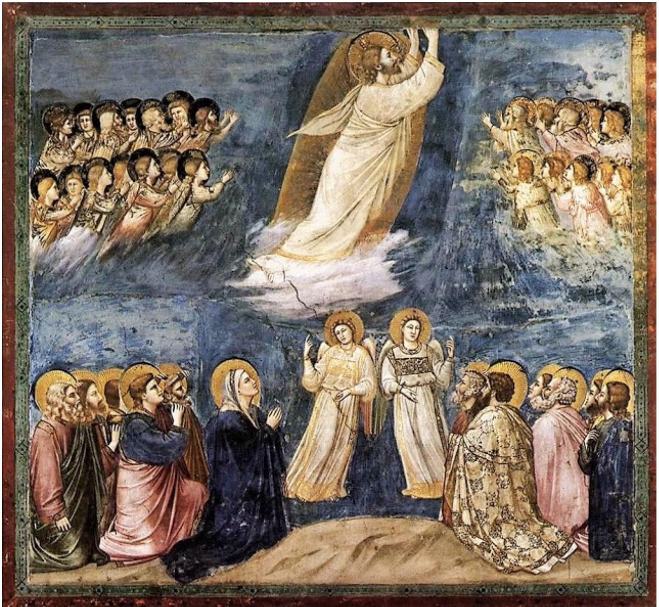
Giotto, Ascension, Italie, Padoue, 1304-1306

Vous allez recevoir une force quand le Saint-Esprit viendra sur vous ; vous serez alors mes témoins à Jérusalem, dans toute la Judée et la Samarie, et jusqu'aux extrémités de la terre. » Après ces paroles, tandis que les Apôtres le regardaient, il s'éleva, et une nuée vint le soustraire à leurs yeux.