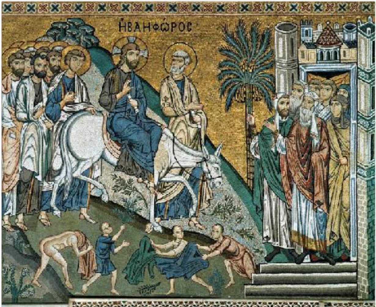
Mosaïque, Jesus entre à Jerusalem, Italie, 1140-1170, Palermo, Chapelle Palatine