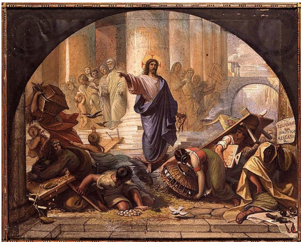
Raymond Balze, Purification du Temple, France, vers 1850 Montauban, Musée Ingres

« Comme la Pâque juive était proche, Jésus monta à Jérusalem. Dans le Temple, il trouva installés les marchands de bœufs, de brebis et de colombes, et les changeurs. Il fit un fouet avec des cordes, et les chassa tous du Temple, ainsi que les brebis et les bœufs ; il jeta par terre la monnaie des changeurs, renversa leurs comptoirs, et dit aux marchands de colombes : « Enlevez cela d'ici. Cessez de faire de la maison de mon Père une maison de commerce. » Ses disciples se rappelèrent qu'il est écrit : L'amour de ta maison fera mon tourment. »