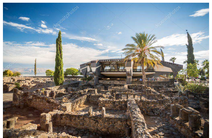
La Maison de Pierre à Capharnaüm

Célébration de la messe au Mont des Béatitudes.