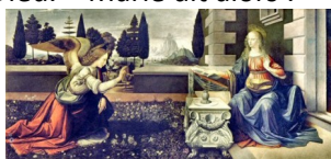
Léonard de Vinci L'Annonciation – 1472 Galerie des Offices, Florence, Italie

En ce temps-là, l'ange Gabriel fut envoyé par Dieu dans une ville de Galilée, appelée Nazareth, à une jeune fille vierge, accordée en mariage à un homme de la maison de David, appelé Joseph ; et le nom de la jeune fille était Marie. L'ange entra chez elle et dit : « Je te salue, Comblée-de-grâce, le Seigneur est avec toi. » À cette parole, elle fut toute bouleversée, et elle se demandait ce que pouvait signifier cette salutation. L'ange lui dit alors : « Sois sans crainte, Marie, car tu as trouvé grâce auprès de Dieu. Voici que tu vas concevoir et enfanter un fils ; tu lui donneras le nom de Jésus. Il sera grand, il sera appelé Fils du Très-Haut ; le Seigneur Dieu lui donnera le trône de David son père ; il régnera pour toujours sur la maison de Jacob, et son règne n'aura pas de fin. » Marie dit à l'ange : « Comment cela va-t-il se faire, puisque je ne connais pas d'homme ? » L'ange lui répondit : « L'Esprit Saint viendra sur toi, et la puissance du Très-Haut te prendra sous son ombre ; c'est pourquoi celui qui va naître sera saint, il sera appelé Fils de Dieu. Or voici que, dans sa vieillesse, Élisabeth, ta parente, a conçu, elle aussi, un fils et en est à son sixième mois, alors qu'on l'appelait la femme stérile. Car rien n'est impossible à Dieu. » Marie dit alors : « Voici la servante du Seigneur ; que tout m'advienne selon ta parole. » Alors l'ange la quitta.