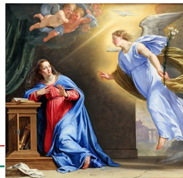
L'Annonciation par Philippe de Champaigne - 1644