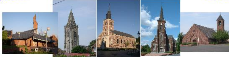
Abscon Escaudain Lourches Neuville Roeux