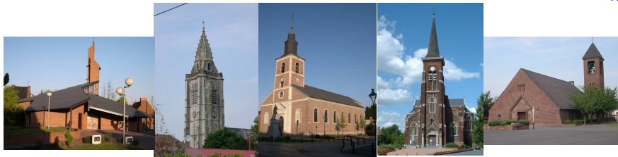
Abcon Escaudain Lourches Neuville Roeux