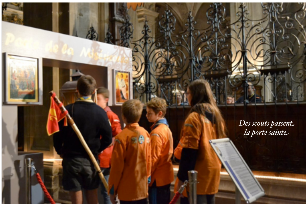
Des scouts passent la porte sainte