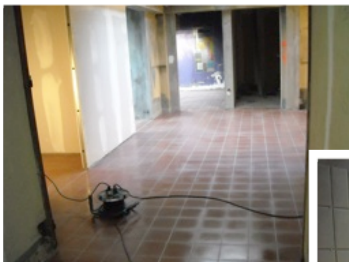
Ça avance à la sacristie