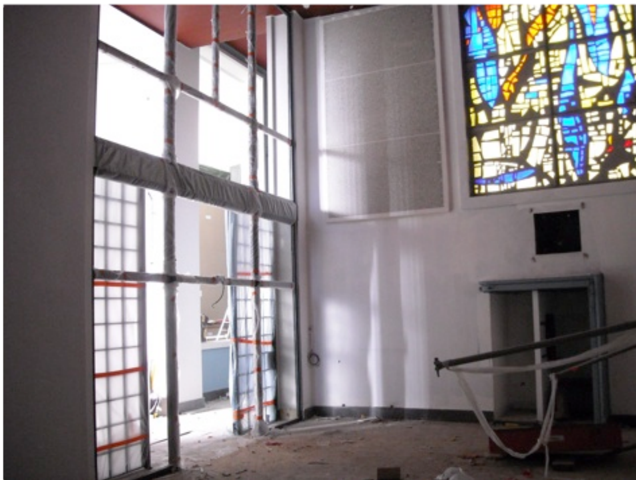
La chapelle du Saint Sacrement.