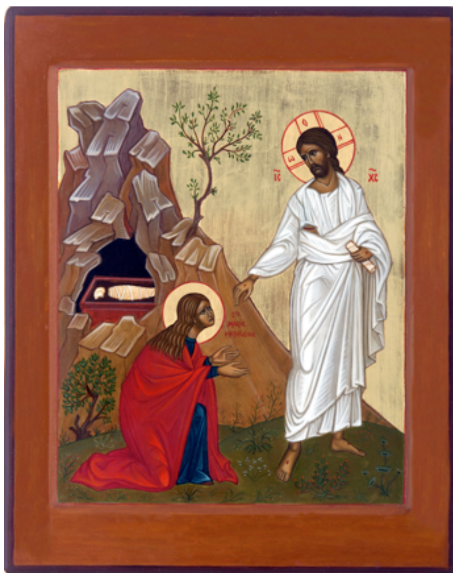
Apparition du Christ ressuscité à Marie Madeleine