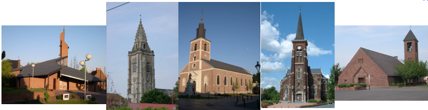
Absson Escaudain Lourches Neuville Roeux