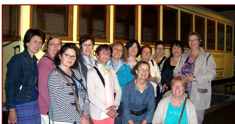
Voyage de fin d'année des catéchistes au familistère de Guise le 11 juin