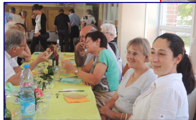
Repas ce 28 juin à Neuville