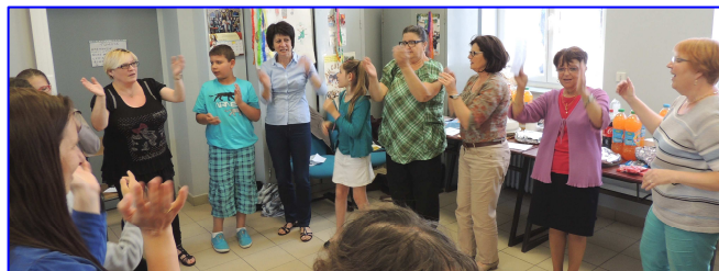
Mercredi 10 juin goûter des enfants du caté d'Abscon et d'Escaudain.