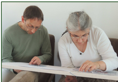
Les brodeurs de la nouvelle bannière