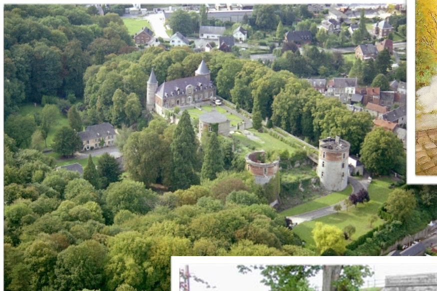
Vues de Beauraing