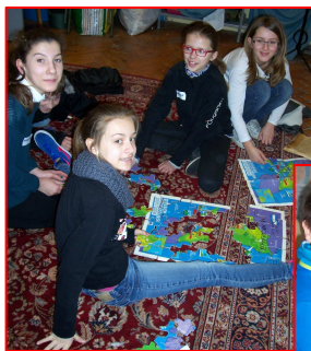
Groupes d'enfants lors de la retraite à Escaudain.