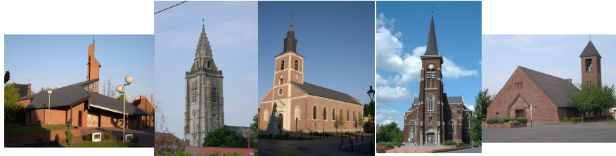
Abscou Escaudain Lourches Neuville Roelux