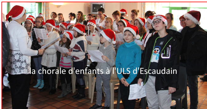
la chorale d'enfants à l'ULS d'Escaudain