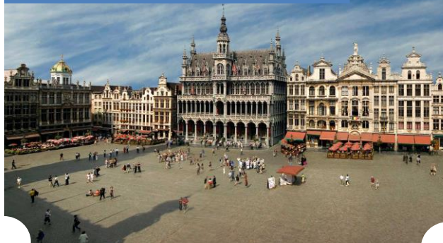
Grand Place de Bruxelles