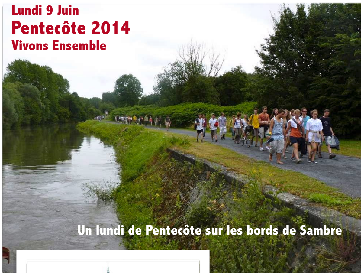
Un lundi de Pentecôte sur les bords de Sambre