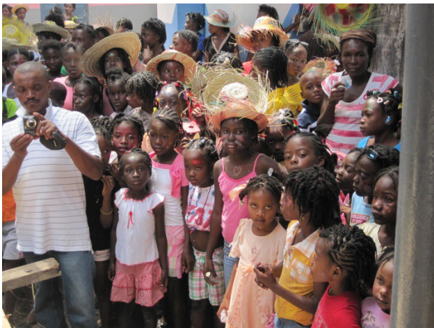
Groupe d'enfants déguisés

Nous avons participé à la fête du carnaval