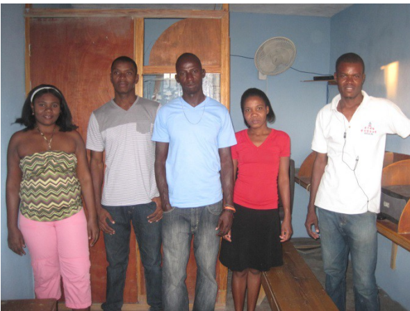
Au CRUDEC avec deux étudiantes

Nous avons également rencontré deux des quatre responsables qui ont mis en place le CRUDEC (centre de documentation informatique) avec le soutien de l'Association et qui reçoivent des étudiants