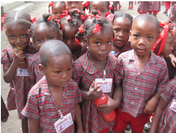
Quelques enfants de la Kay Ti Moun