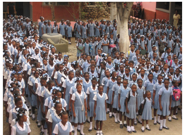
Rassemblement dans la cour de l'école