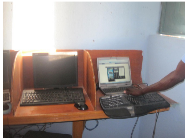
matériel mis à la disposition des étudiants