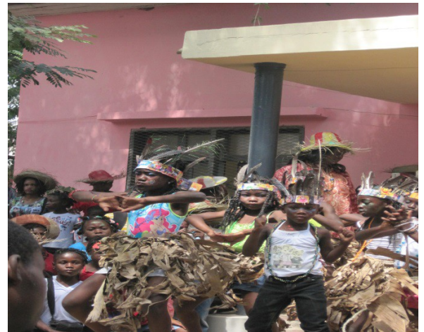
Danse sur l'estrade

et rencontré des personnes de Saint Michel avec lesquelles les sœurs sont en lien.