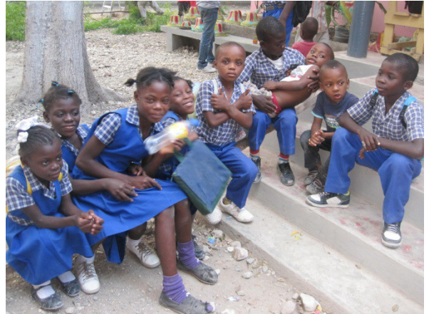
Jeunes du cours du soir (école Ste Union)

Nous avons participé à la fête du carnaval