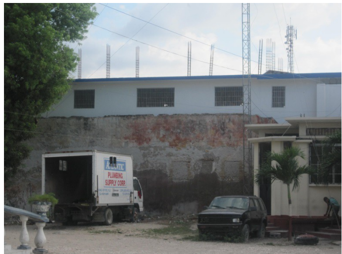
Dos de la prison