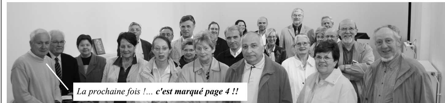
La prochaine fois !... c'est marqué page 4 !!